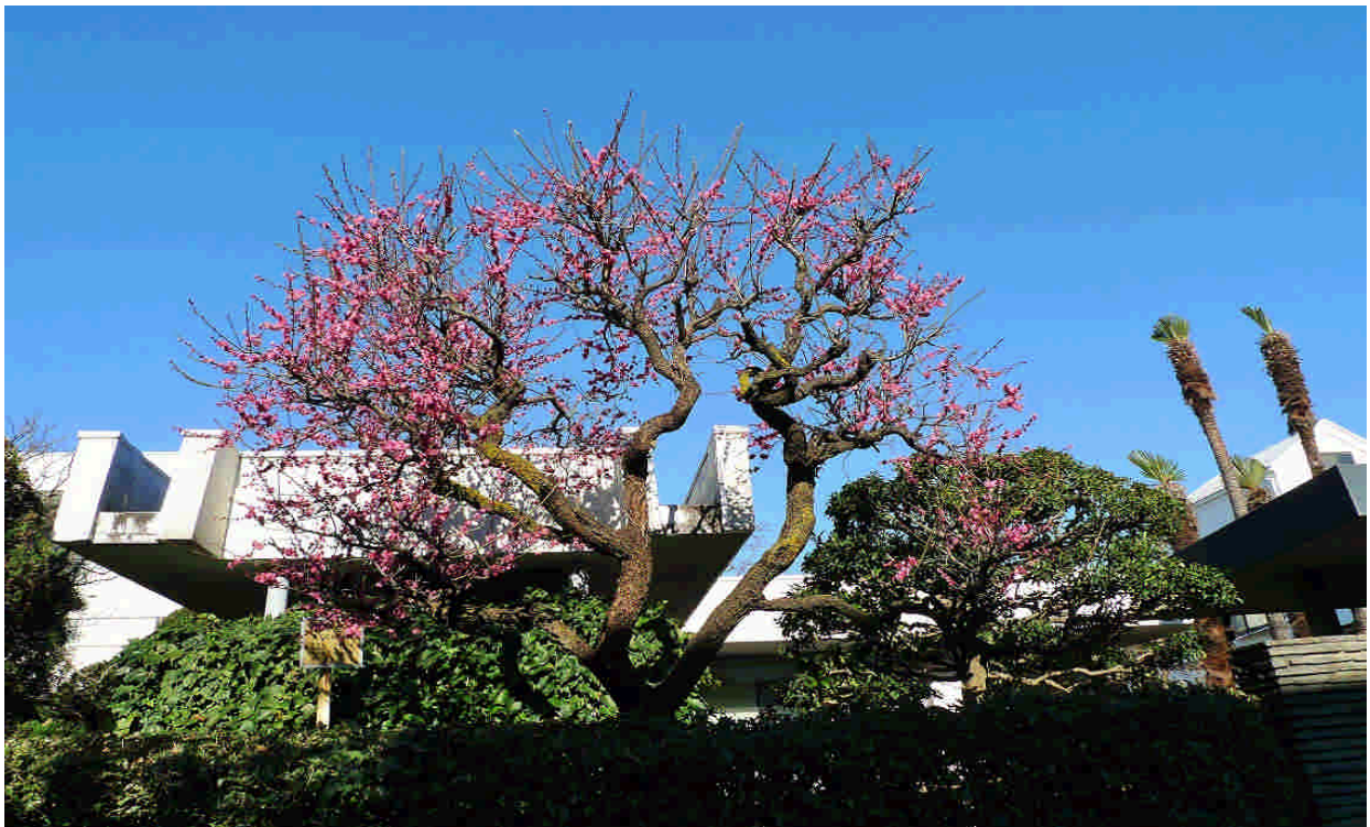
(2020年2月、豊島区、紅梅の開花)

さて、嵐が過ぎて早く春よ来い！と熱望する事務局より「会員ニュース(107号)」をお届けします。