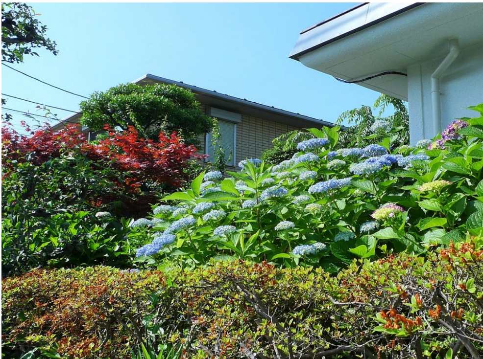
(2017年5月、練馬区、晴れ間の紫陽花)

さて、あちこちで出現する「民主主義国家における一強」が、「独裁」に重なって見えてしまう事務局より「会員ニュース(74号)」をお届けいたします。