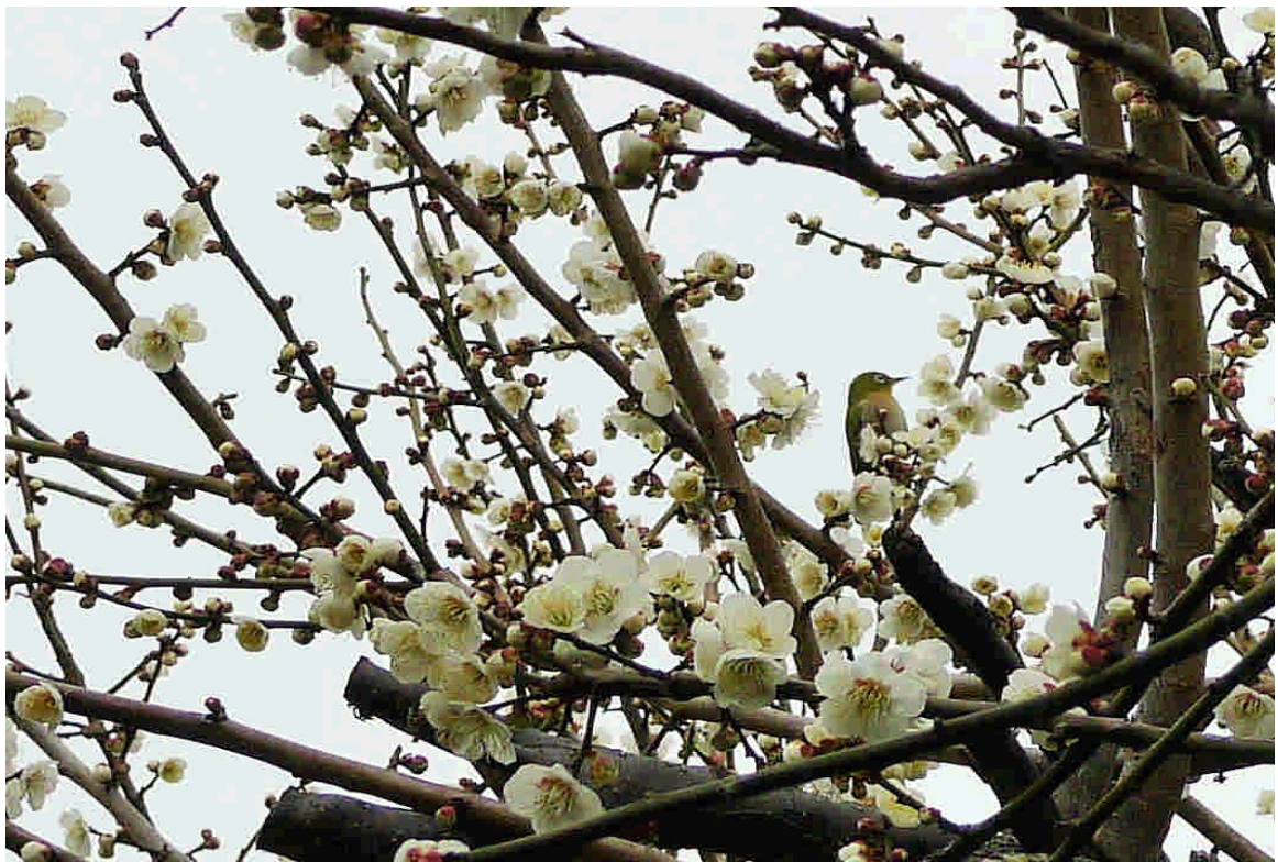
(2019年2月、練馬区 やっと咲いた白梅に遊ぶ目白)

さて、南の海では既に台風1号が発生したとか。沖縄からの熱風を吸収して「雪解けの春」を運んで来て欲しいと願う事務局より「会員ニュース(95号)」をお届けします。